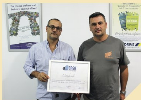
CASA MATOSINHOS LEÇA DO BALIO