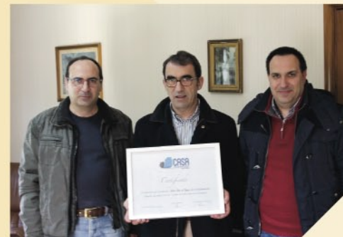
CASA S. M. FEIRA S. JOÃO DE VER