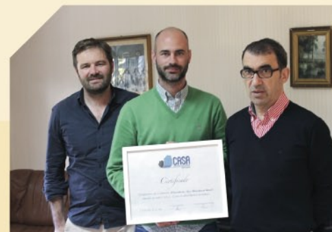
CASA PORTO PARANHOS