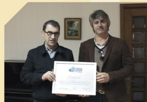
CASA SEIXAL AMORA