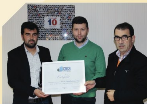
CASA MARCO DE CANAVESES