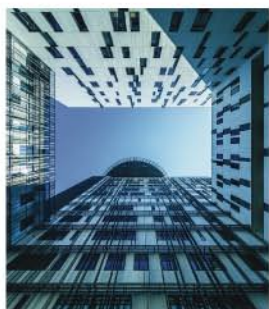
Sede da Polícia Judiciária, Lisboa

A Glassolutions é uma Marca Saint-Gobain, que se dedica à transformação e comercialização de vidro plano, sendo a Covipor a sua empresa em Portugal.