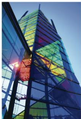
Centro Comercial Allegro, Setúbal

POR RUI OLIVEIRA SILVA RESPONSÁVEL MERCADO REGIONAL